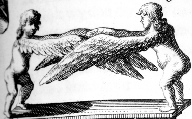
de Cherubinen volgens Arias Montanus.